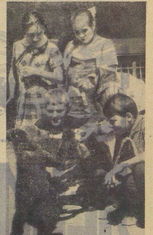
Его зовут Мих-Мих. Он живёт по соседству с кроликами, черепашкой, филином и козлом. Только почему-то ребята его любят больше. Охотников дать Мих-Миху тёплого молока, побахаться с ним на лесной полянке — хоть отбавляй. Присаёт девочку — ветер прихватит траву, отнесит косички в сторону. Ждут ребята, когда она собьётся. А чего ей собьётся? Весело девочкам. Всем весело в этом пионерском лагере возле села Никольское в Подмосковье. А у вас?